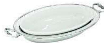
asia vegetable dish with china insert cod. 57134 Legumiera con pirofila porcellana Gemüeschüssel mit Porzellaneinsatz Légumier avec porcelaine - Legumbrera con porcelana

equipped with 1 china baking dish - provvisto di 1 pirofila in porcellana - Mit 1 Porzellaneinsatz ausgestattet - équipé avec 1 porcelaine - provisto de 1 contenedor de porcelana.