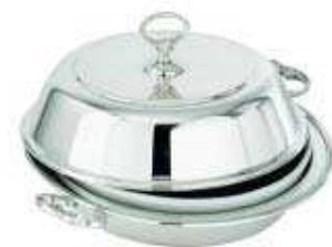
asia vegetable dish with cover cod. 57135 legumiera con coperchio - Gemüeschüssel mit Deckel légumier avec couvercle - legumbrera con tapa

equipped with 1 china baking dish - provvisto di 1 pirofila in porcellana - Mit 1 Porzellaneinsatz ausgestattet - équipé avec 1 porcelaine - provisto de 1 contenedor de porcelana.