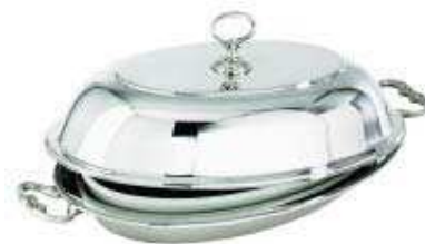
asia vegetable dish with cover cod. 57134 legumiera con coperchio - Gemüeschüssel mit Deckel légumier avec couvercle - legumbrera con tapa

equipped with 1 china baking dish - provvisto di 1 pirofila in porcellana - Mit 1 Porzellaneinsatz ausgestattet - équipé avec 1 porcelaine - provisto de 1 contenedor de porcelana.