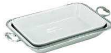
asia vegetable dish with china insert cod. 57131 Legumiera con pirofila porcellana Gemüeschüssel mit Porzellaneinsatz Légumier avec porcelaine - Legumbrera con porcelana

equipped with 1 china baking dish - provvisto di 1 pirofila in porcellana - Mit 1 Porzellaneinsatz ausgestattet - équipé avec 1 porcelaine - provisto de 1 contenedor de porcelana.