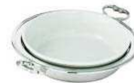
asia vegetable dish with china insert cod. 57135 Legumiera con pirofila porcellana Gemüeschüssel mit Porzellaneinsatz Légumier avec porcelaine - Legumbrera con porcelana

equipped with 1 china baking dish - provvisto di 1 pirofila in porcellana - Mit 1 Porzellaneinsatz ausgestattet - équipé avec 1 porcelaine - provisto de 1 contenedor de porcelana.