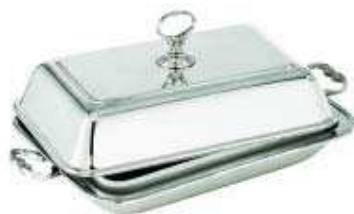
asia vegetable dish with cover cod. 57131 legumiera con coperchio - Gemüeschüssel mit Deckel légumier avec couvercle - legumbrera con tapa

silverplated argentario size. in. ht. dim. cm. h.