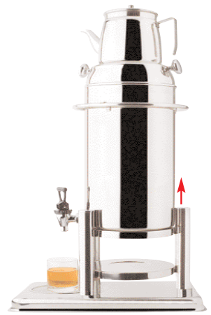
Samovar It 10 completo di teiera It 2. Base in acciaio. Samovar It 10 with tea pot It 2. Stainless steel base. Samovar It 10 provisto de teiera It 2. Base de acero. Samovar It 10 avec théière It 2. Base en acier. H cm 72+20 - L cm 41x28 - Lt 10+2