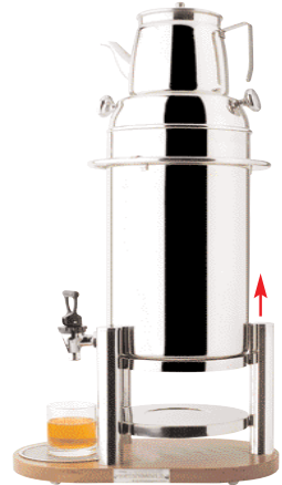
Samovar It 10 completo di teiera It 2. Base in legno. Samovar It 10 with tea pot It 2. Wood base. Samovar It 10 provisto de teiera It 2. Base de madera. Samovar It 10 avec théière It 2. Base en bois. H cm 72+20 - L cm 38x22 - Lt 10+2