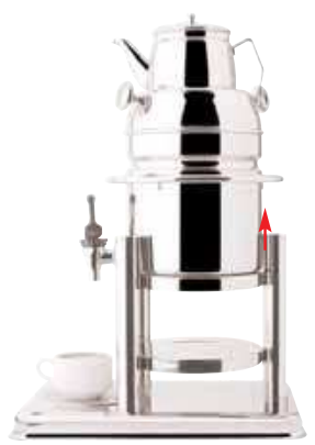
Samovar It 5 completo di teiera It 1. Base in acciaio. Samovar It 5 with tea pot It 1. Stainless steel base. Samovar It 5 provisto de teiera It 1. Base de acero. Samovar It 5 avec théière It 1. Base en acier. H cm 43+13 - L cm 41x28 - Lt 5+1