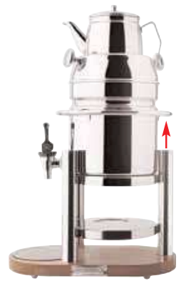
Samovar It 5 completo di teiera It 1. Base in legno. Samovar It 5 with tea pot It 1. Wood base. Samovar It 5 provisto de teiera It 1. Base de madera. Samovar It 5 avec théière It 1. Base en bois. H cm 43+13 - L cm 38x22 - Lt 5+1