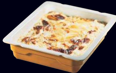
FUENTE GASTRO'HOTEL 1/1

T821.1 - Dim. 53 x 32,5 x 6,5 - Cap. 7,00 L U/C 1 - ○ 37,56 € - ○ 63,31 €