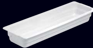
FUENTE GASTRO'HOTEL 2/4

T822.4 - Dim. 53 x 16,2 x 6,5 - Cap. 2,90 L U/C 2 - ○ 15,97 € - ○ 47,81 €