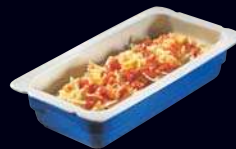
FUENTE GASTRO'HOTEL 1/3

T821.3 - Dim. 32,5 x 17,6 x 6,5 - Cap. 1,90 L U/C 1 - ○ 9,81 € - ○ 18,54 €