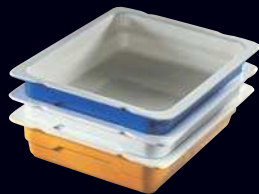
FUENTE GASTRO'HOTEL 1/2

T821.2 - Dim. 32,5 x 26,5 x 6,5 - Cap. 3,00 L U/C 1 - ○ 17,60 € - ○ 28,64 €