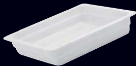
FUENTE GASTRO'HOTEL 2/3

T822.3 - Dim. 35,2 x 32,5 x 6,5 - Cap. 4,00 L U/C 1 - ○ 24,49 € - ○ 37,91 €