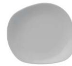
plato pan bread plate