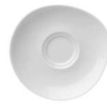
platillo té-café saucer tea-coffee