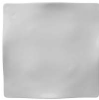
plato liso flat plate