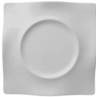
plato llano dinner plate