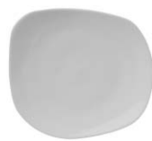
bandeja de picas irregular plate